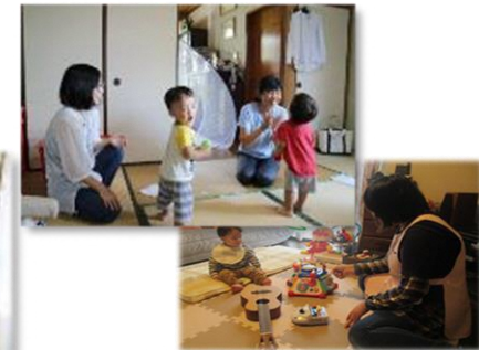
育児支援のイメージ