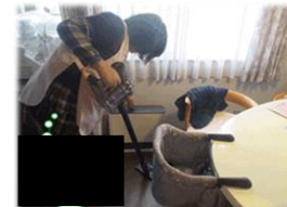
家事支援のイメージ