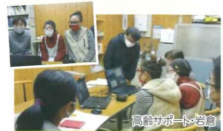
高齢サポート・岩倉

(全国キャラバン・メイト連絡協議会より、各地域の新型コロナウイルス感染者の発生状況等を考慮した上で、従来通りの対面式での講座開催が困難であり、かつ、開催ニーズが高い認知症サポーター養成講座については、オンライン講座の開催が可能であると示されています。)