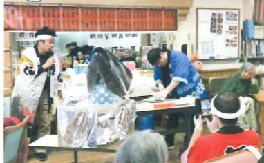
元魚屋の腕前を活かして魚の解体ショー

元気な当事者がたくさんいる。 今、闇の中にいる人が早く希望にたどりつけばと思う。認知症かもしれないと不安に思っている人がいたら、一歩踏み出して！と伝えたい。一緒に前を向いて歩こう！と言いたい。まわりにおられる家族や専門職さんにも、当事者が一歩を踏み出す支えをしてほしい。