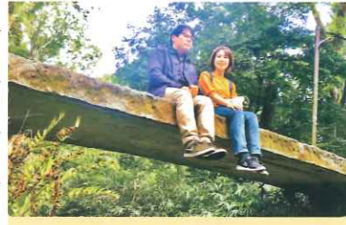
奥さんと二人三脚

46歳の時、何かおかしいと感じた。いつもできてたことができない。身近な人の名前がでてこない。認知症と診断された時は、まさか自分が…と思った。認知症は高齢の方がなるものだと思っていたし、認知症の知識もなかった。知識がないからネットで「認知症 症状」「認知症 進行」と検索すると2年で寝たきりになるとか、認知症になると終わりというような情報しかなかった。今思うと、「認知症 楽しい」「認知症 幸せ」と検索したら違ったかもしれないけど。診断直後は、誰にも会いたくない。何もしたくないと思った。闇の中にいるような気持ちだった。