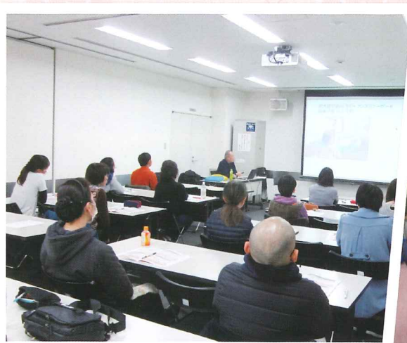
介護技術研修のようす