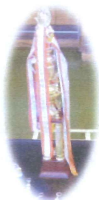
優勝トロフィーと参加賞

施設行事で風船バレー大会を開催しました。失語症や注意障害、記憶の低下などがある方も、普段見られない積極的な発言や応援などがあり、白熱した楽しい試合になりました！