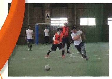
オレンジカップ 認知症の人と一緒にフットサルを楽しんでいます。