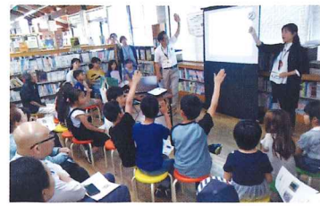
認知症サポーター養成講座の様子