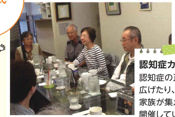
認知症カフェ・サロン 認知症の正しい理解を広げたり、認知症の人や家族が集える場を開催しています。