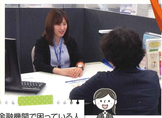
金融機関で困っている人の話をじっくり聞く等丁寧な対応を心掛けています。