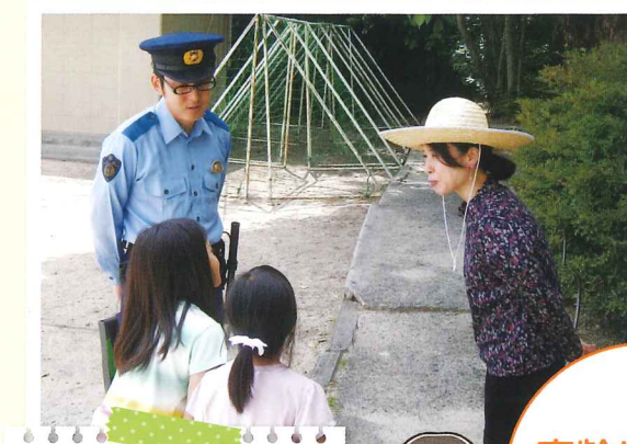
地域の取組で子どもと一緒に声かけ訓練をしています。

認知症に対する正しい理解をもつことは、現在の認知症の人やその家族を支えるだけでなく、今後認知症になるかもしれない自分を支えることにもつながります。