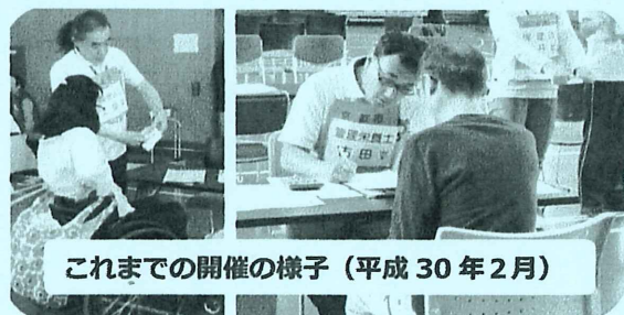
これまでの開催の様子(平成30年2月)