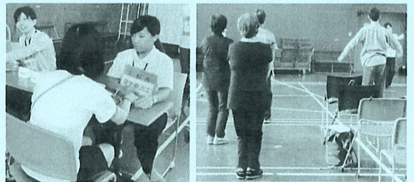
これまでの開催の様子(平成29年9月)