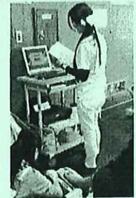
これまでの開催の様子(平成29年2月)