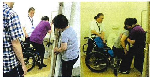
実際のトイレの場面で介助法を学びます