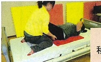
お互いに負担のない移動方法の体験中