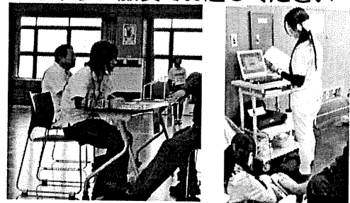
これまでの開催の様子(平成29年2月)