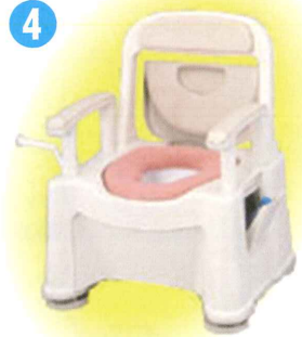
品名: ポータブルトイレ座楽背もたれ型 SP小口径便座タイプ 品番: SPTSPMB