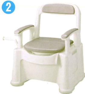
品名: ポータブルトイレ座楽背もたれ型 SPソフト便座・便フタタイプ 品番: SPTSPS