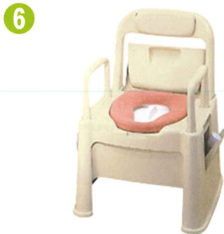
品名: ポータブルトイレ座楽 背もたれ型SB 品番: SPTSB