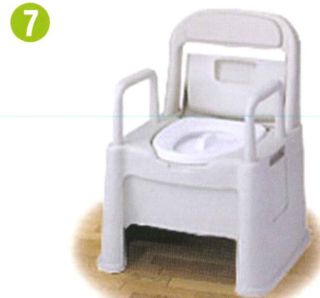
品名: ポータブルトイレ座楽 背もたれ型HD 品番: SPTH