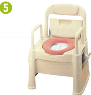
品名: ポータブルトイレ座楽 背もたれ型 品番: SPTSD