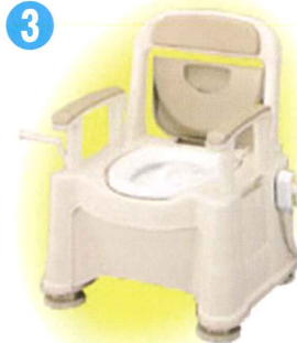
品名: ポータブルトイレ座楽 SP あたたか 品番: APTSP