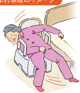
はさまれ事故のイメージ

ご使用中のお客様には大変ご迷惑をおかけいたしますことを深くお詫び申し上げます。何卒ご理解とご協力をお願い申し上げます。