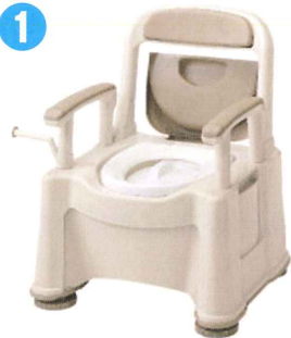
品名: ポータブルトイレ座楽 背もたれ型 SP 品番: SPTSP